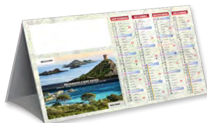
COMPTOIR FRANCE - TARIF T13