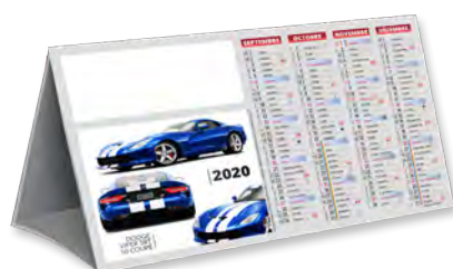
COMPTOIR DESIGN CAR - TARIF T13