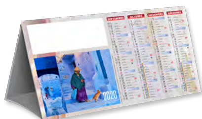
COMPTOIR COULEURS VOYAGE - TARIF T13