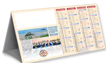
COMPTOIR PATRIMOINE - TARIF T13