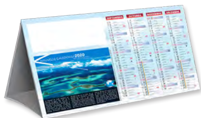
COMPTOIR COUP D'ŒIL - TARIF T13