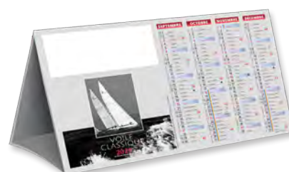
COMPTOIR VOILE - TARIF T13