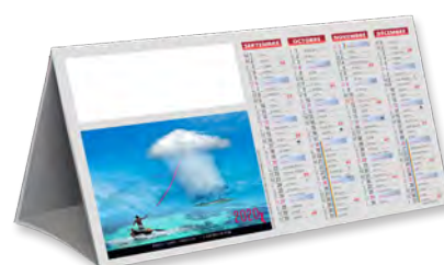
COMPTOIR IMPROBABLES - TARIF T13