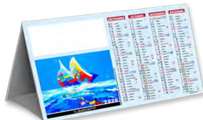
COMPTOIR IMAGINAIRES - TARIF T13