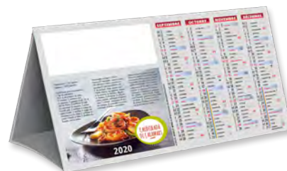
COMPTOIR RECETTES - TARIF T13