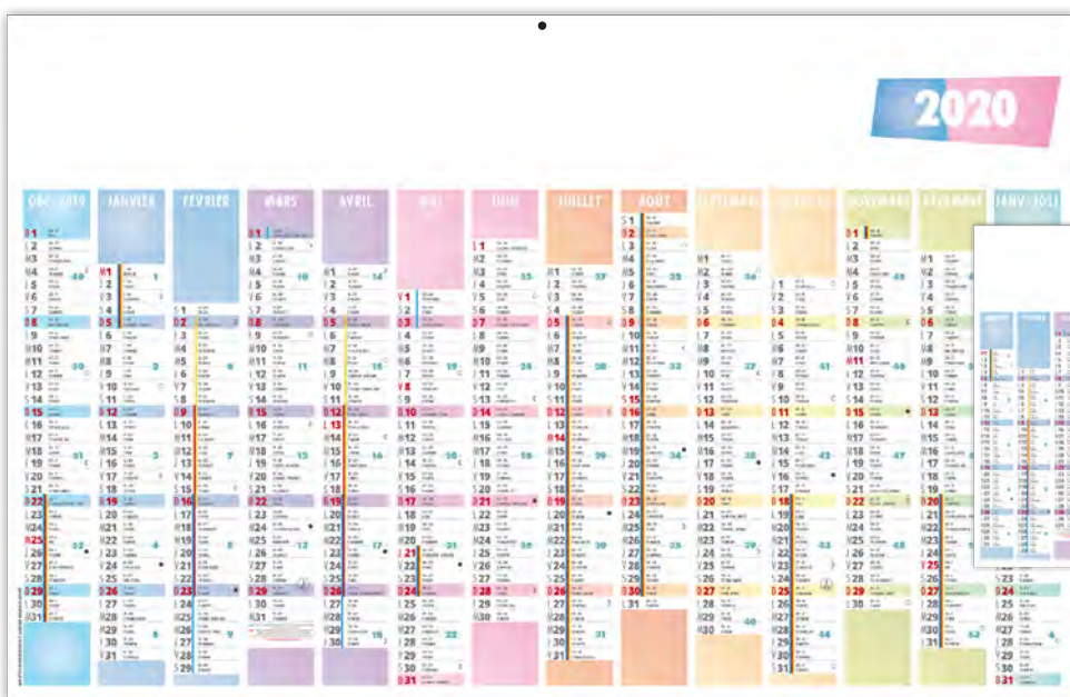
MINI 12 MOIS, DOS CARTE ROUTIÈRE NON REPIQUÉ

10 DOS REPIQUÉS AU CHOIX POUR LES MAXIS CC RIGIDES OU MAXIS LÉGERS SOUPLES VOIR P. 102-103